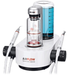
에어플로우® 프로릴락시스 마사터