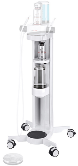
에어플로우® 스테이션 +