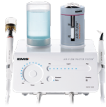
에어플로우® 마스터 피에존