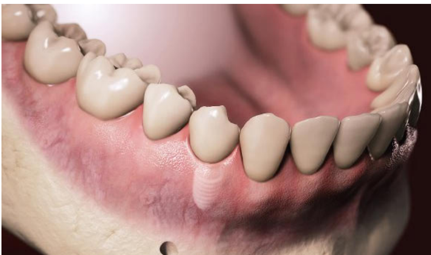
Gesunde, entzündungsfreie Gingiva

dend für das Auftreten und Fortschreiten der Periimplantitis. Das Wissen um die Pathogenese der Periimplantitis erleichtert das Verständnis für präventive Maßnahmen. Ziel der Behandlung ist, das Auftreten der Periimplantitis zu verhindern oder den Fortschritt dieser Entzündungsreaktion zu stoppen. Der implantologisch tätige Zahnarzt kann seine Behandlung auf der Basis des Wissens um die biologischen Hintergründe der Periimplantitis durchführen.