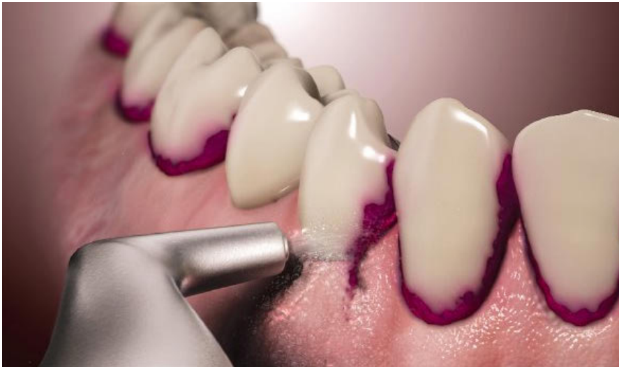
Biofilmentfernung mittels Airpolishing