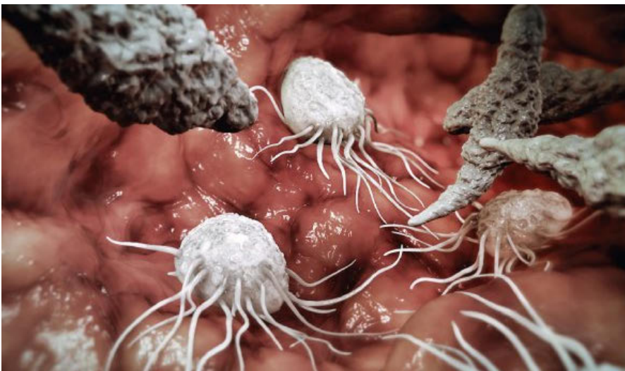
Neutrophile Granulozyten initiieren die Entzündungsreaktion