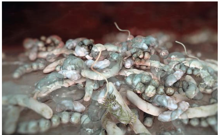
Koaggregation verschiedener Bakterienspezies auf Oberflächen