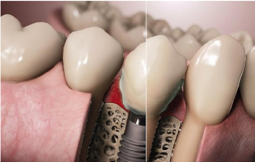
Periimplantäre Mukositis versus Parodontitis