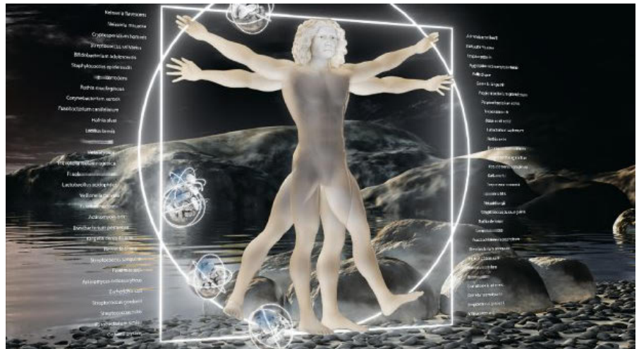
Der Mensch als Holobiont – auf eine Körperzelle kommen zwei Bakterienzellen