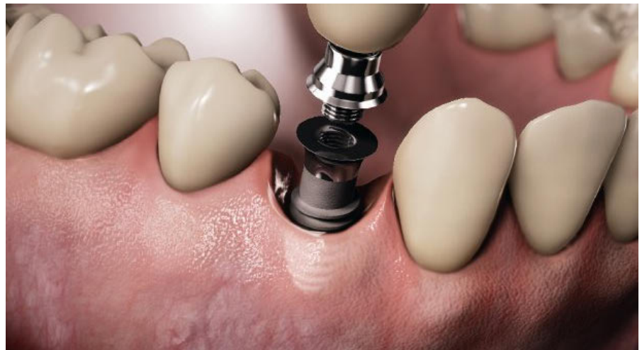
Implantatgetragene Einzelzahnkrone mit gesundem, periimplantären Sulkus