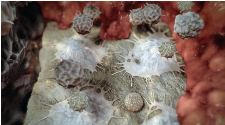
Antikörper des Immunsystems induzieren die Differenzierung von Osteoklasten.