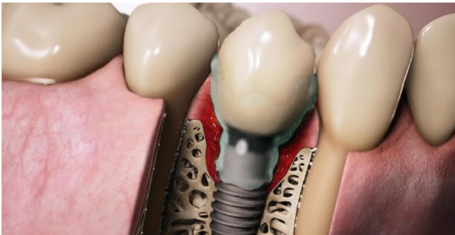
Zirkumferenter periimplantärer Defekt – manifeste Periimplantitis

Einige Bakterien lagern sich mithilfe sogenannter Adhäsine an Zahn- und Implantatoberflächen an. Weitere Bakterien können sich als Sekundärbesiedler koaggregieren und werden Spätbesiedler genannt. Problematisch wird die Situation oft, wenn Bakterien mit den aufgerauten, enossalen Implantatanteilen in Berührung kommen. Aufgeraute Oberflächen zeigen zwar Vorteile für die knöcherne Einheilung des Implantats, sind im Fall einer Mukositis aber ein gutes Substrat für eine bakterielle Besiedlung. Bakterien bilden Polysaccharide, die die Matrix für den Biofilm schaffen. Durch den Austausch von Metaboliten und genetischen Inhalten zwischen Bakterien entsteht ein bakterielles Gruppenverhalten, das sich den Umgebungsbedingungen anpasst und sich der körpereigenen Immunabwehr besser anpassen kann.