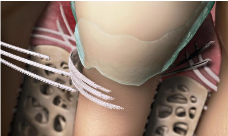
Anordnung Dentogingivaler Fasern