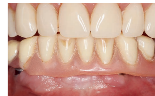
Fig. 9 Contrôle à 15 jours. Cette patiente sera revue dans 3 mois pour une réévaluation de la situation.