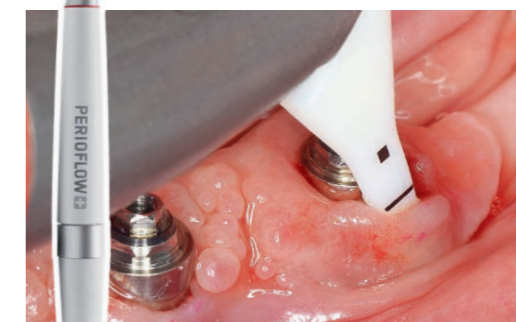
Fig. 7 Assainissement de la poche parodontale avec la busette PERIOFLOW et la poudre Plus. La busette est délicatement introduite dans la poche puis un mouvement de va-et-vient pendant 5 secondes est appliqué.