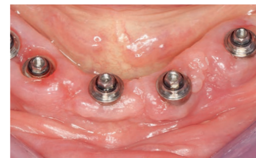
Fig. 8 Dépose et contrôle à 8 jours après l'assainissement.