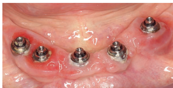
Fig. 3 Situation initiale - La prothèse supra-implantaire est déposée afin d'améliorer l'accès lors du traitement.