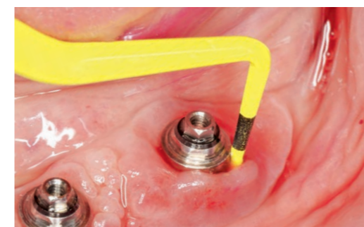
Fig. 6 Sondage de la poche, profondeur : 8 mm en vestibulo-distal.