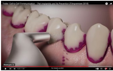
Abb. 2 Einsatz von Airflow (schematisch) – Ausschnitt aus dem Film „Kommunikation der Zellen: Periimplantitis und ihre Prävention“, der 2018 im Quintessenz Verlag erschienen ist.

die initiale Beschränkung der Therapie auf die weniger invasive subgingivale Pulverstrahlreinigung nach sechs Monaten am Studienende zu einem verbesserten Attachment-Gewinn führen würde, bewahrheitete sich jedoch nicht. Statistisch konnte bezüglich des Attachment-Gewinns kein Vorteil unseres zweistufigen Reinigungsansatzes festgestellt werden.