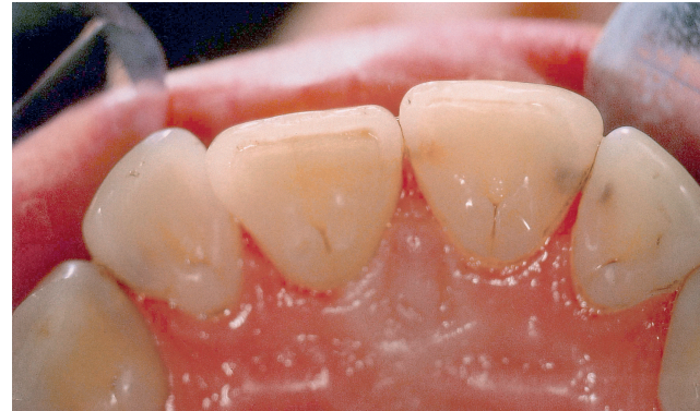
Abb. 3.2.: Sichtbarkeit der kariösen Läsion nach der GBT

tes Pulver, welches auf allen Oberflächen der Mundhöhle sicher angewendet werden kann.