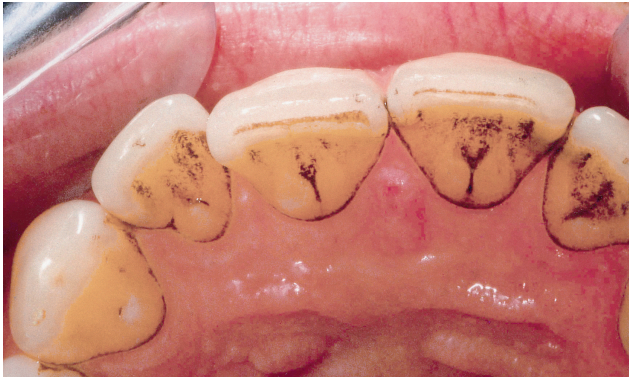
Abb. 3.1: Extrinsische Verfärbungen, die die kariöse Läsionen verdecken © Dr. W. Gutwerk