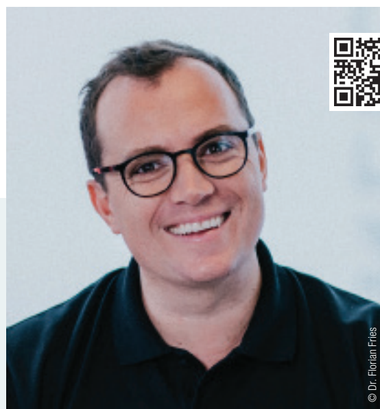
© Dr. Florian Fries EMS – Infos zum Unternehmen

Für die GBT®-Zertifizierung mussten Sie zunächst in Ausrüstung und die Fortbildung Ihrer Mitarbeiterinnen investieren. Hat sich das gelohnt?