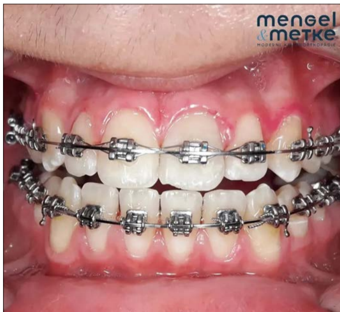
... und nach der Behandlung mit dem Airflow Prophylaxis Master und dem Plus Pulver von EMS.