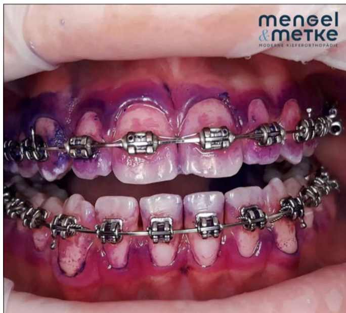
Guided Biofilm Therapie in der KfO-Praxis: Situation nach dem Anfärben ...

Die Entfernung von Plaque vom Zahnschmelz im Umfeld der Brackets ist schwierig. Gelingt es mit dem Airflow-Gerät, auch unter Bögen und Ligaturen zu reinigen?