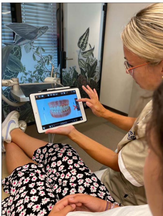
Schon bei der ersten Nachkontrolle wird mit den Patienten besprochen, ob sie die Tipps zur Pflege umsetzen konnten und im Handling mit den Reinigungsbürsten zurechtkommen.